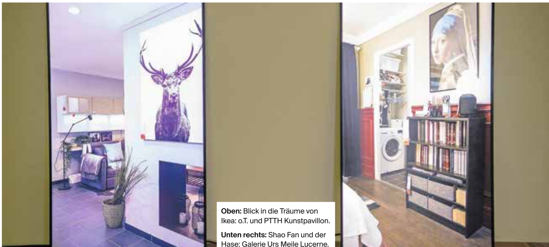
Oben: Blick in die Träume von Ikea: o.T. und PTTH Kunstpavillon.