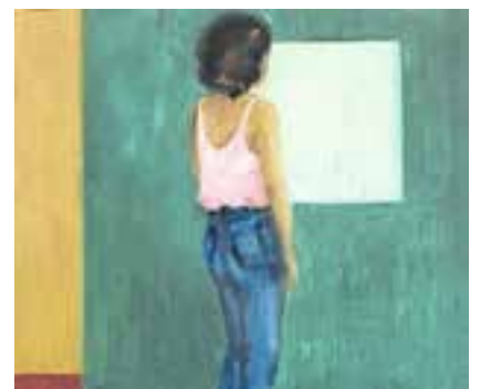
Ein Werk von Gabi Fuhrmann, gemalt in Öl auf Holz.

Benzholz Raum für zeitgenössische Kunst, Meggen: «Nach Innen Sehen». Gabi Fuhrmann, Rahel Scheurer. www.benzholz.ch