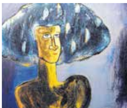
Der kubanische Künstler Pango legt einen Fokus auf Porträts.

Löwengalerie Luzern: «Pinseloesie». Pango oder Barbaro M. Reyes Mesa. www.loewengalerie.ch