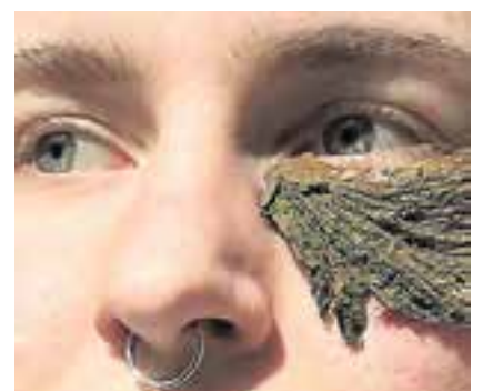
Werk von Lara Bischof: «Worden Eye». Fotografie, 2021.

HSLU Studiengang Kunst++Vermittlung: «Cut the Mustard». 18 Studierende des Bachelor Studiengangs Kunst++Vermittlung Hochschule Luzern. www.kannichallesdarfichalles.com