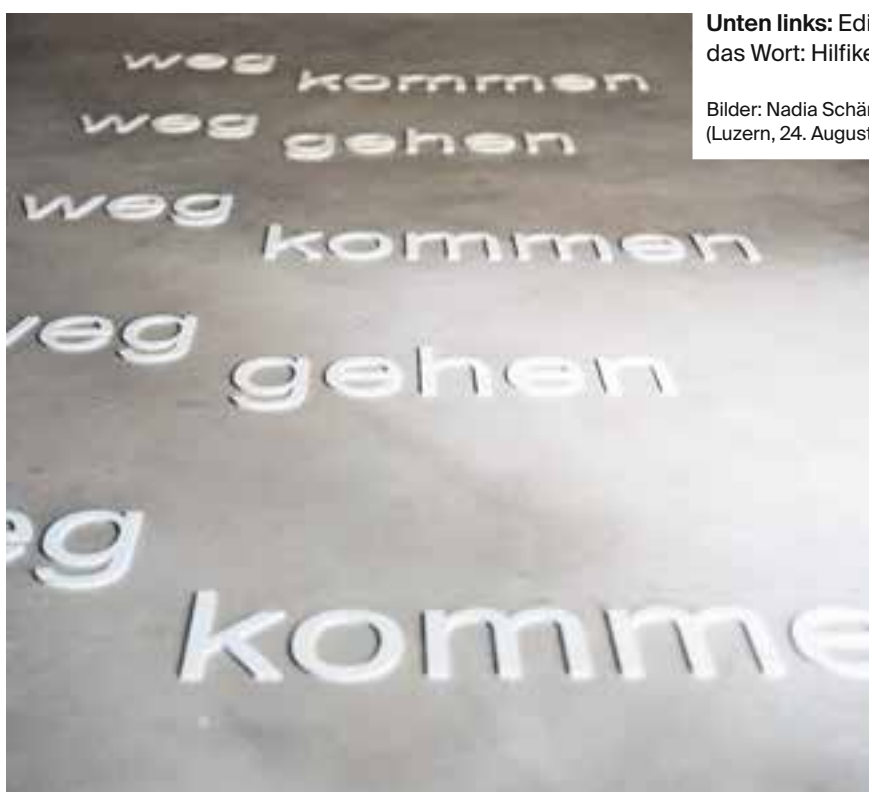
(Luzern, 24. August 2021)